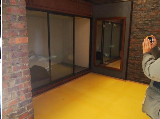
2층 구 전시실