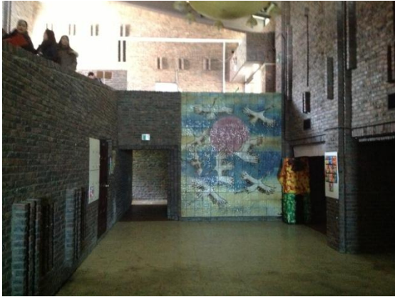
소양강홀 앞 공간