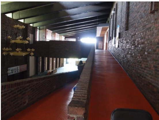
1 - 2층 연결 층계