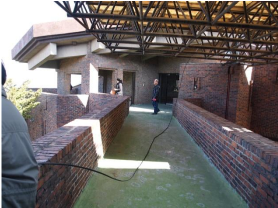
A동 - B동 연결 옥상