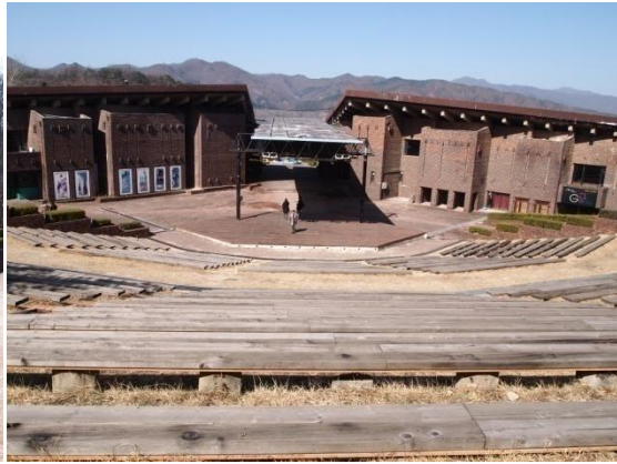
야외공연장 상단 공터